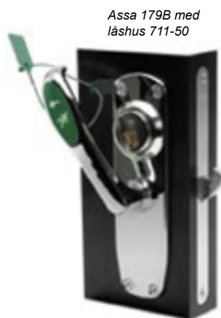
Assa 179B med låshus 711-50