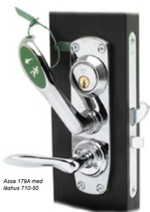
Assa 179A med låshus 710-50

Nödutrymningsbeslag enligt europastandard SS-EN 179 för moduldörr