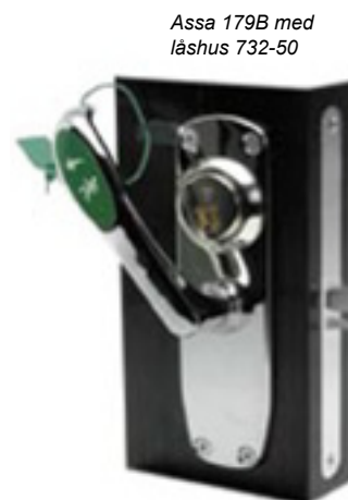
Assa 179B med låshus 732-50